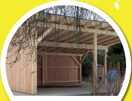
Wir fördern Unterricht im Freien