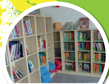
Wir unterstützen die Bücherei