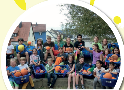
Wir finanzieren Pausenkisten