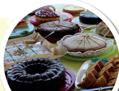
Wir organisieren Buffets